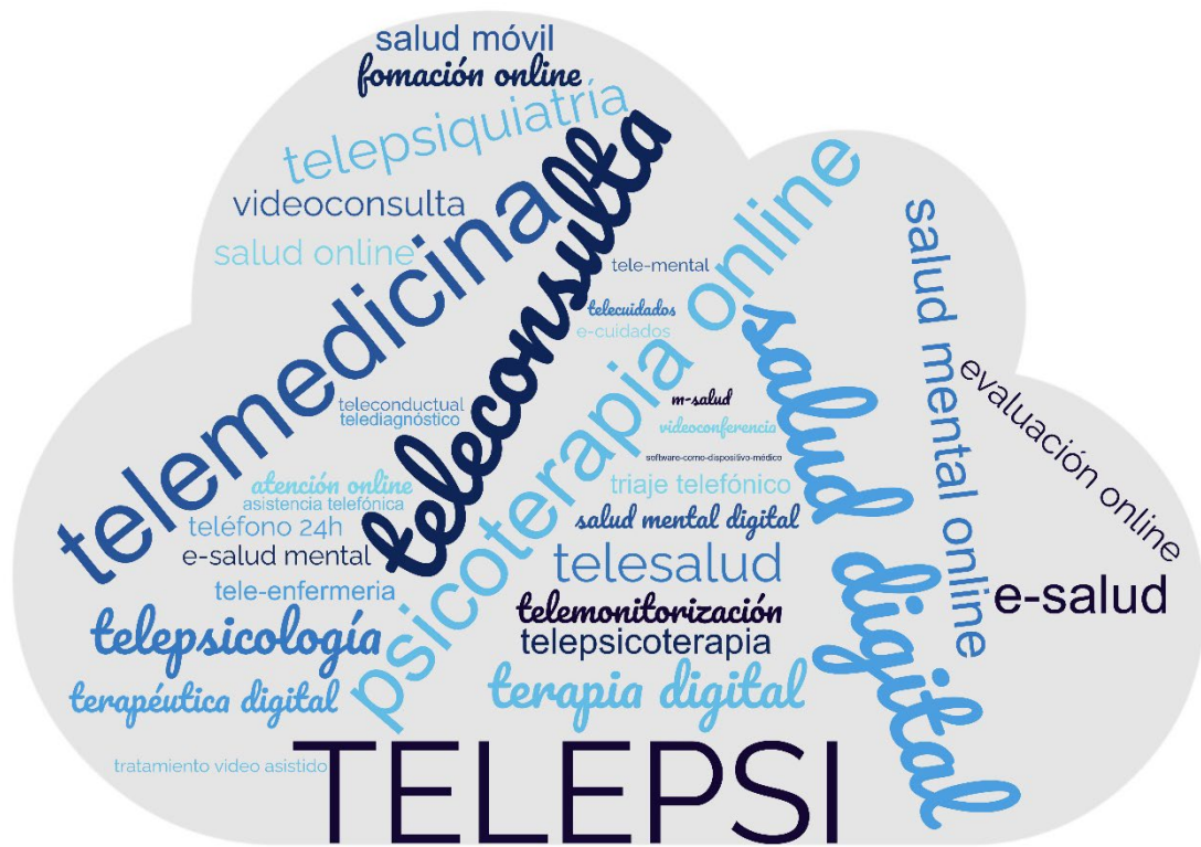
Ilustración 1: Conceptos utilizados en salud mental digital