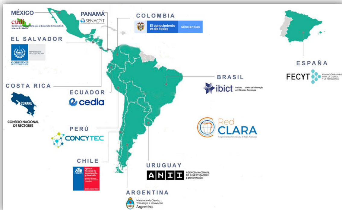
Ilustración 3: Red federada de Repositorios Institucionales de Publicaciones Científicas o LA Referencia ( https://www.lareferencia.info/es/institucional/quienes-somos )

Portable Research Instrument Standard for Mental Health (PRISMH) ahora ha pasado a denominarse Research Instrument Open Standard ( RIOS ) el estándar abierto del instrumento de investigación de cara a los sistemas de captura electrónica de datos (Electronic Data Capture, EDC)